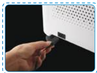
Phù hợp với các tiêu chuẩn về điện Comply with national standards