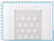
Cửa khí vào Air Inlet